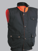
kamizelka obustronna reversible vest

dodatki odblaskowe reflective accessories